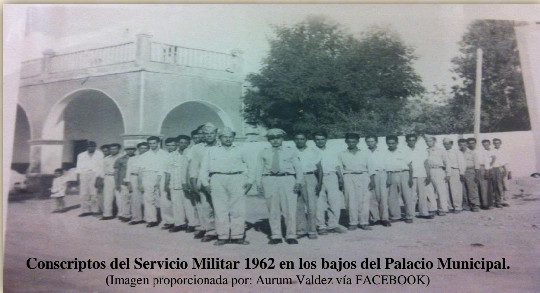
Conscriptos del Servicio Militar 1962 en los bajos del Palacio Municipal.