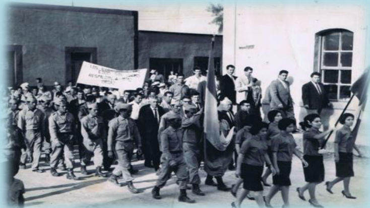
Mitin Político en apoyo al Candidato Presidencial Lic. Gustavo Días Ordaz. 1964